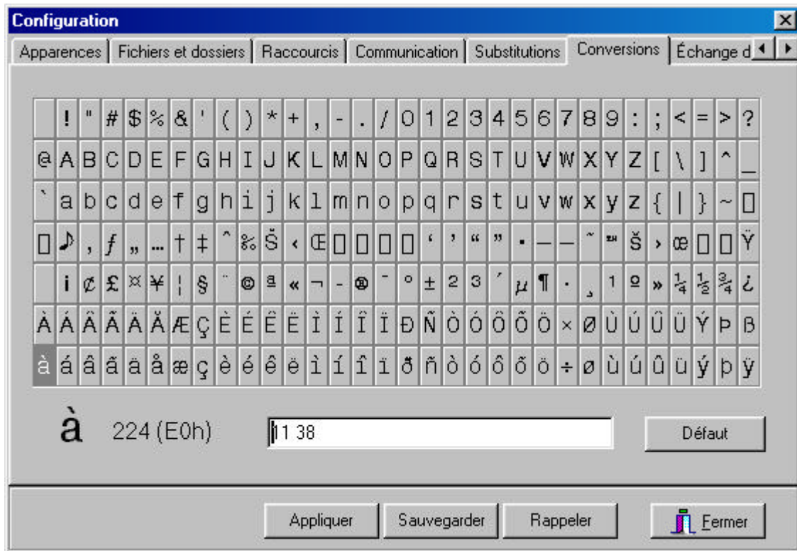
Dialogue de configuration

La boîte de dialogue des options n'est accessible qu'au personnel autorisé selon le profil d'utilisateur. Cette boîte comporte plusieurs pages.